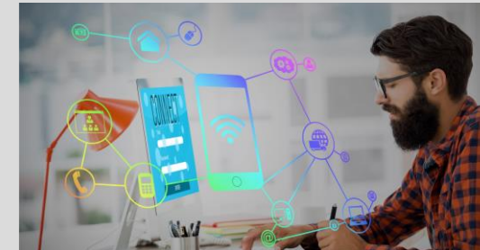
Digitale Transformation KI-Systeme